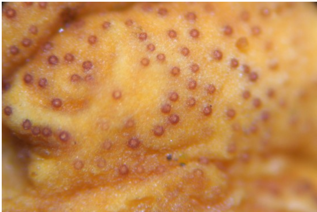
C. Ostiolos 4,5x.