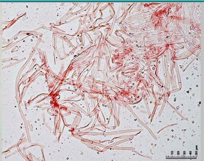
4. Pelos del borde del sombrero cilíndricos, septados y con punta roma