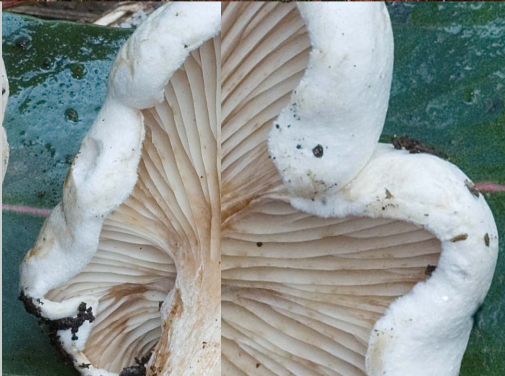
Detalles del borde del sombrero ligeramente velutino. Recolecta 26/12/07