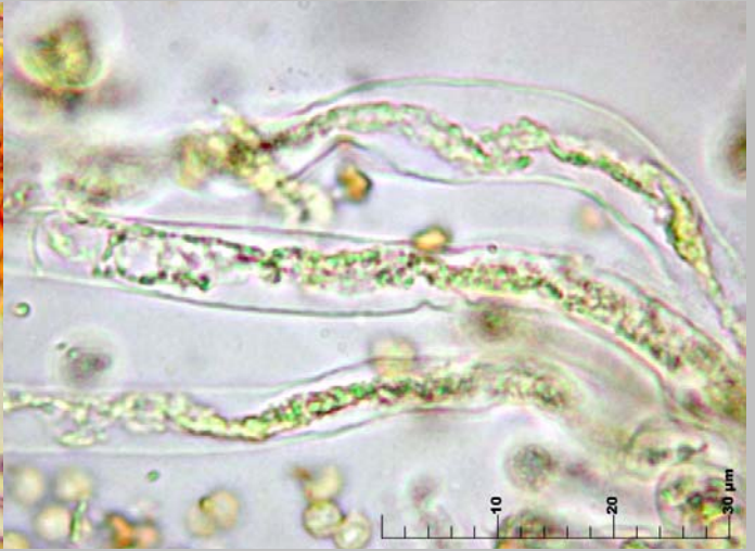
3. Hifas de la trama fibuladas