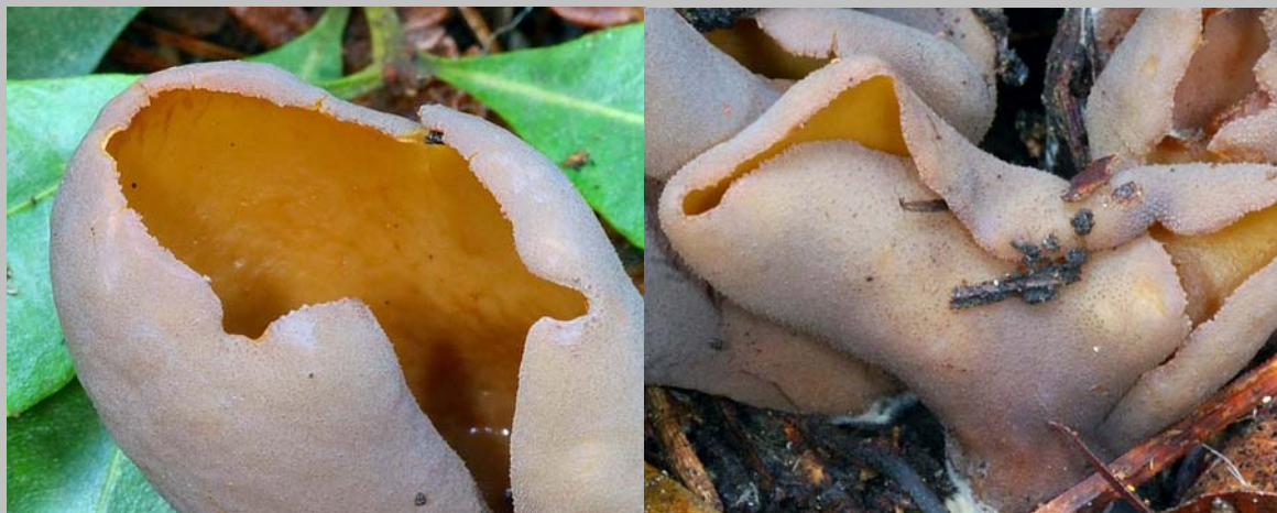
Detalle de la carne amarilla (izquierda) y de las granulaciones del excípulo ectal (derecha)