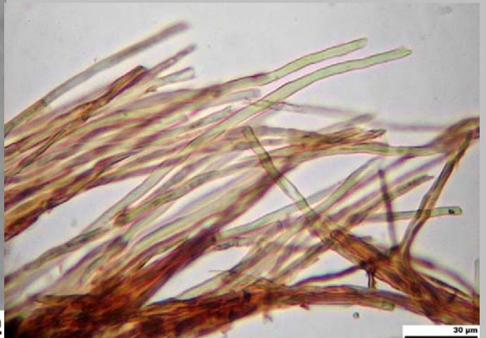
Foto 2 Pelos de la cara externa x200

Medida de esporas tomadas del himenio (x1000)