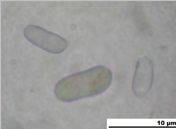
Foto 1 Esporas x1000