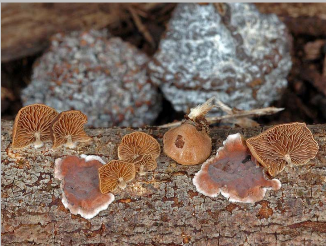
Ejemplares jóvenes de Stereum illudens compartiendo hábitat con Psilocybe hepatochrous