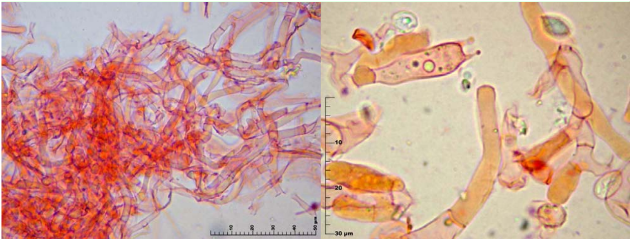
3. Cutícula en cutis con transición a tricoderma, sin pigmentos ni fíbulas (izquierda) e hifas sin fíbulas (derecha)