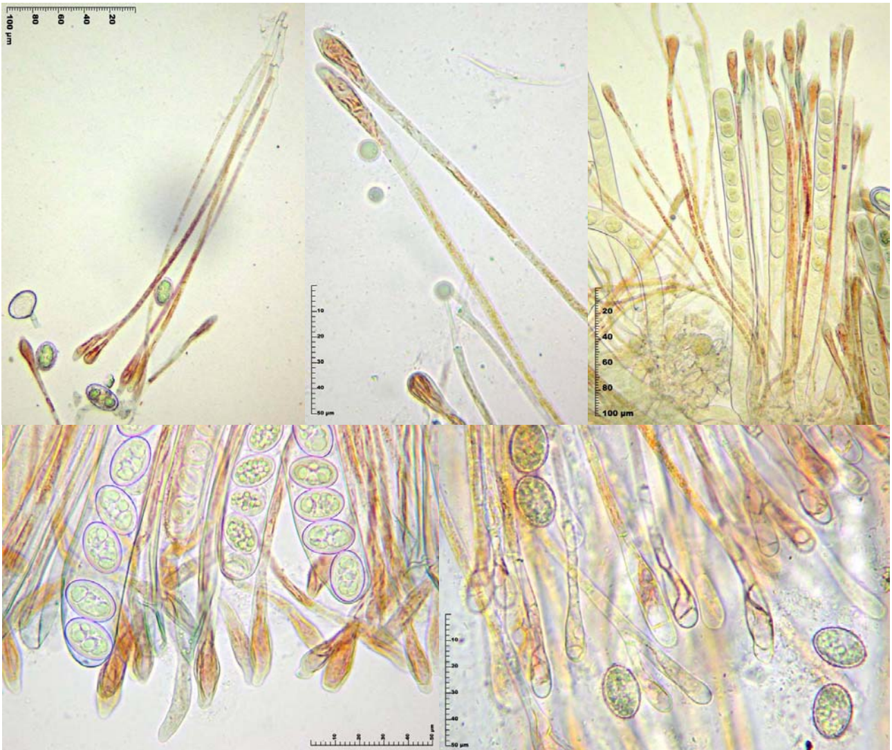
3. Paráfisis cilíndricas, rectas, septadas, bifurcadas desde la base y en ocasiones cerca del ápice, engrosadas hasta 7,3 [8,6 ; 9,5] 10,8; Me = 9,04