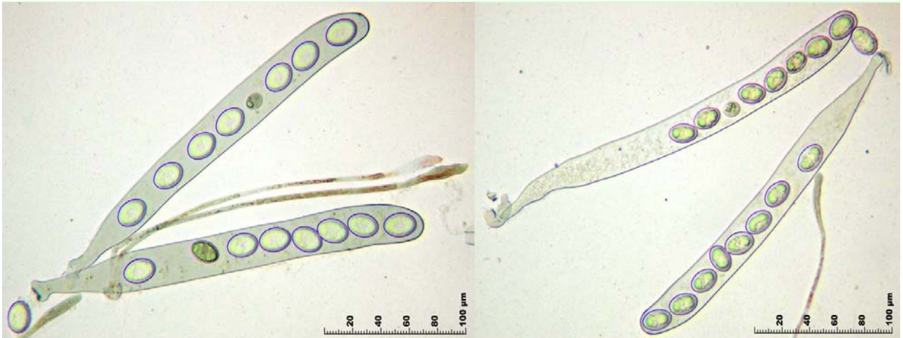
1. Ascas cilíndricas, octospóricas, uniseriadas y no amiloides