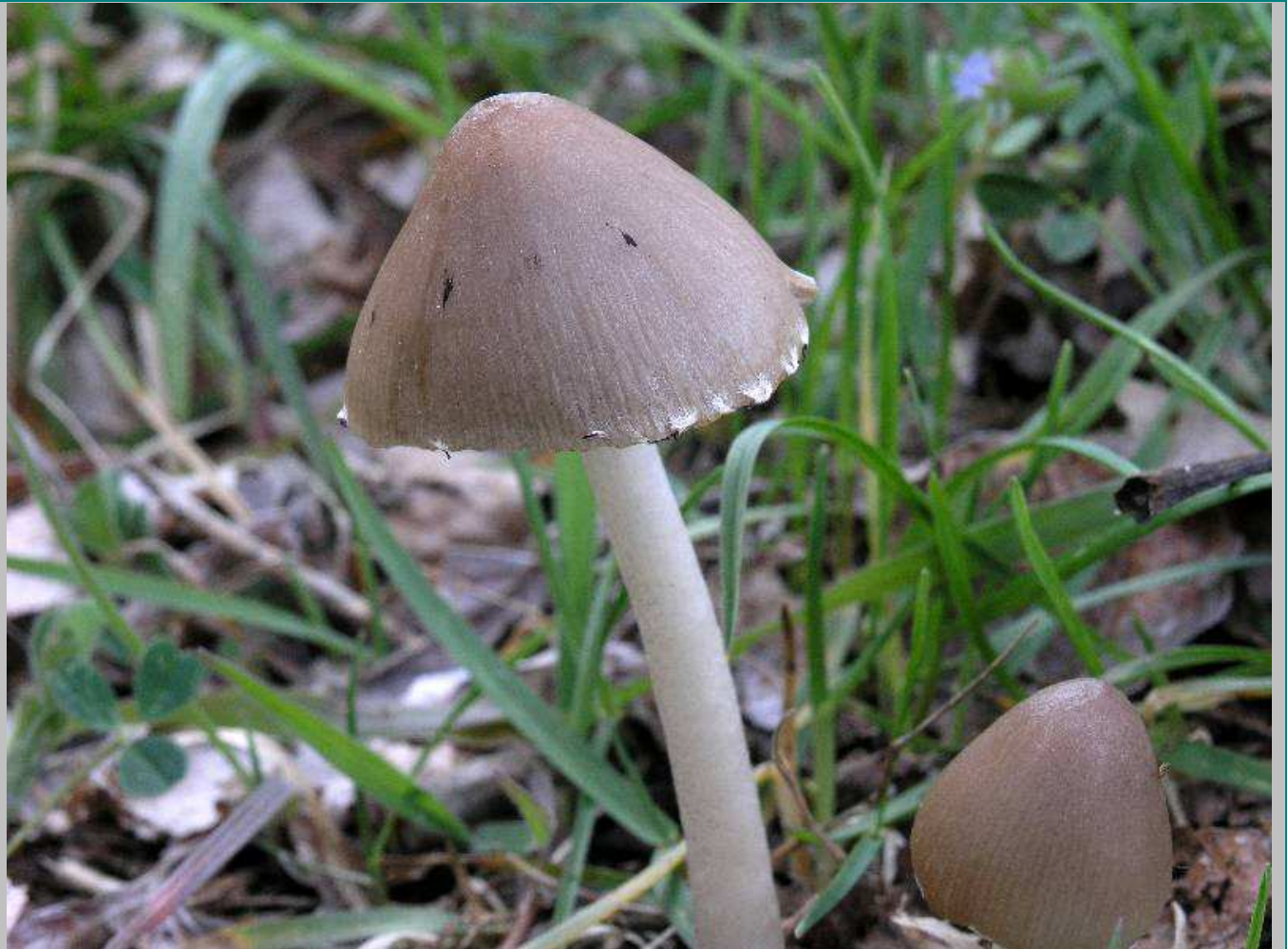
4. © F. Pancorbo.