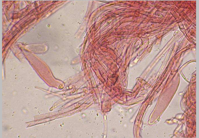
4. Caulocistidios parte superior y media del pie