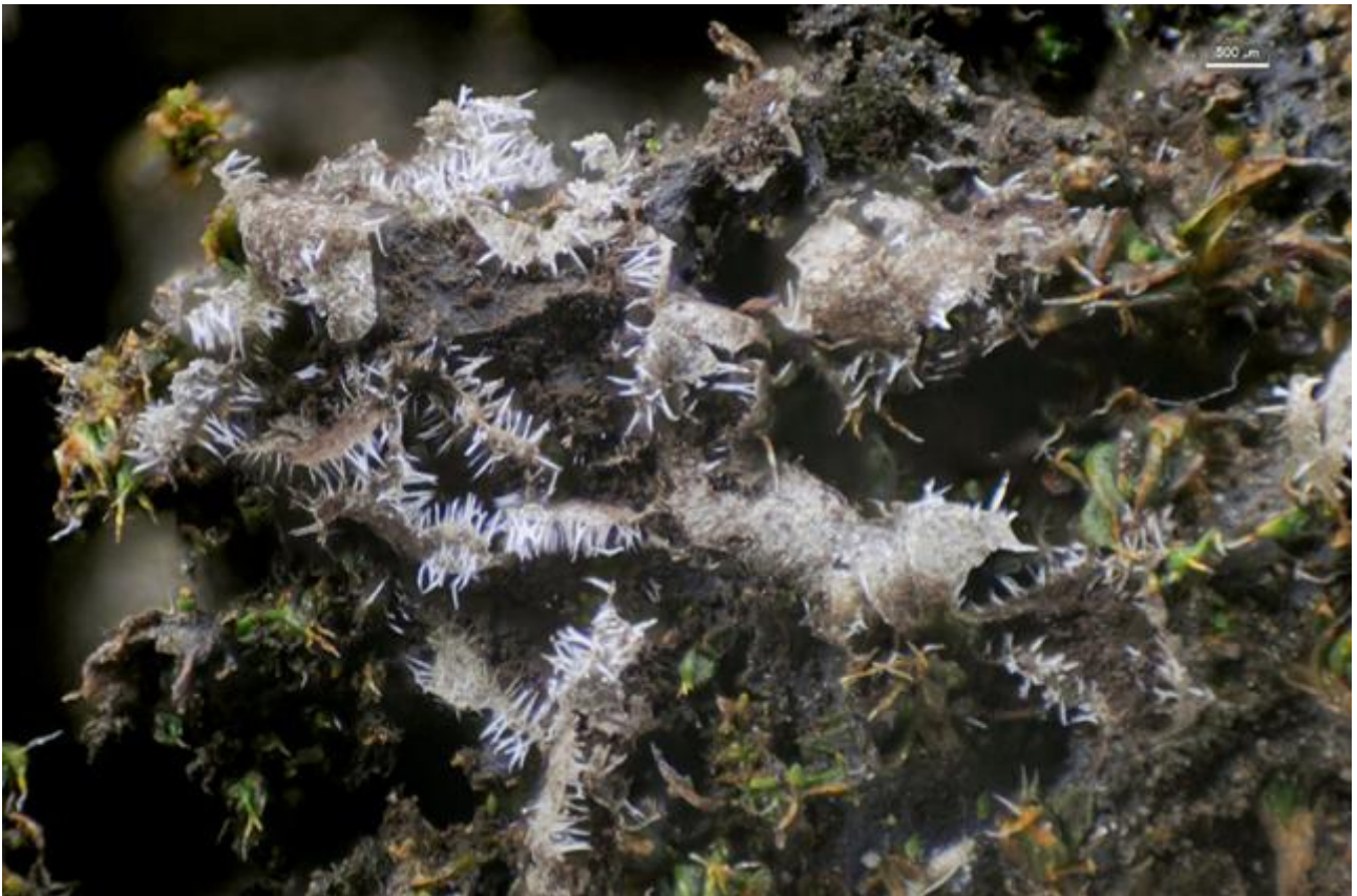
D. Esporocarpos dehiscencia 40x.