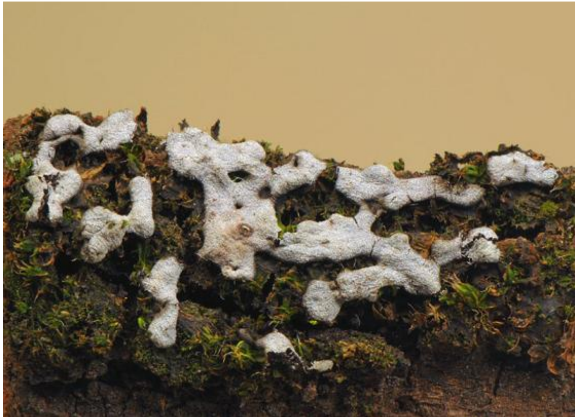
Physaraceae, Physarida, Incertae sedis, Myxogastrea, Mycetozoa, Amoebozoa, Protozoa

(Yamash.) T.E. Brooks & H.W. Keller, Mycologia 68 (4): 836 (1976)