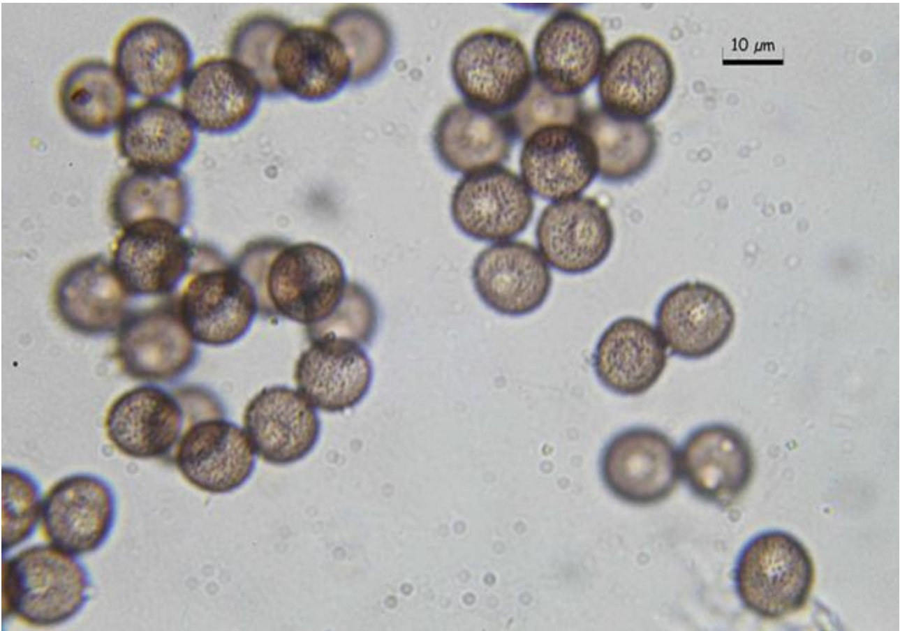
A. Esporas agua 1000x.