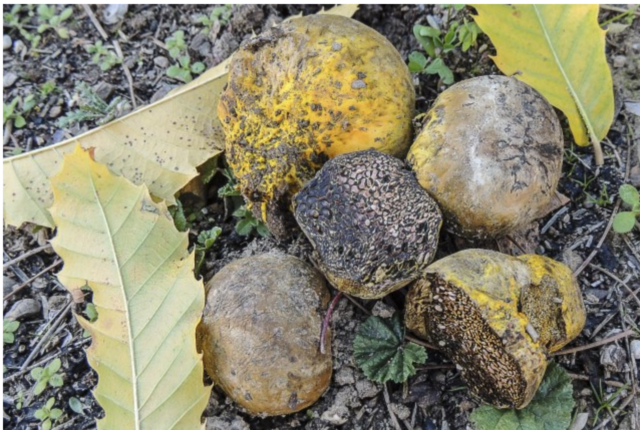
Sclerodermataceae, Boletales, Agaricomycetidae, Agaricomycetes, Agaricomycotina, Basidiomycota, Fungi

(Scop.) Rauschert, Z. Pilzk. 25(2): 50 (1959)